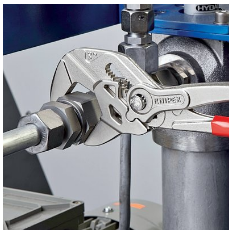
ersetzt einen Satz Schraubenschlüssel, metrisch wie zöllig