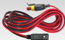
Verlängerungskabel 2.5 m - 029057